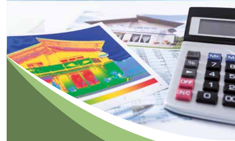
Foto Titel: © shutterstock/ Andrey_Popov, Hausgrafik: © KTW Konzernkommunikation